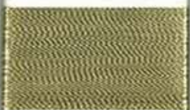
4012 white gold