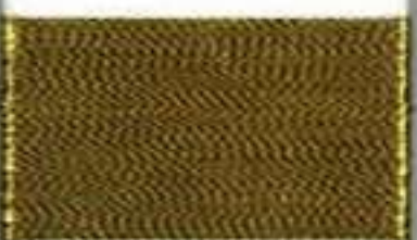
4015 pure gold