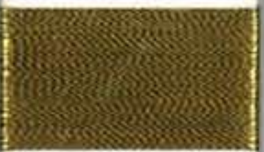
4017 fine gold