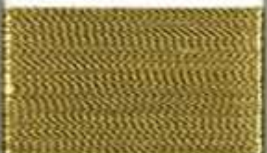
4013 gold dust