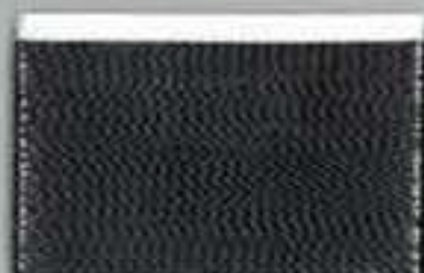
4060 black pearl