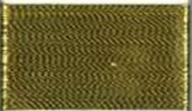
4014 gold nugget